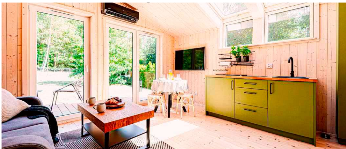
Funkcjonalne i przestronne wnętrza