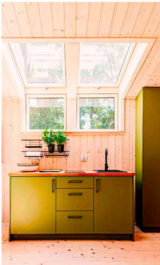
Kuchnia z widokiem na gwiazdy