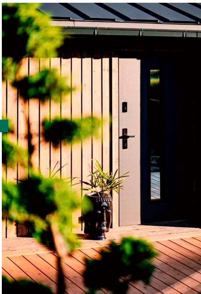
Stolarka renomowanych producentów zapewnia bezawaryjny dostęp i bezpieczeństwo